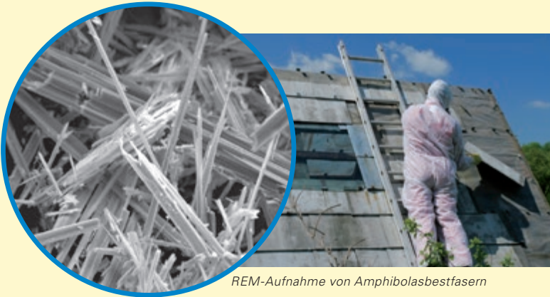
REM-Aufnahme von Amphibolasbestfasern

Trotz Verwendungsverbot sterben in Deutschland nach wie vor Menschen an den Folgen asbestbedingter Krankheiten, weil sie bei Tätigkeiten mit Asbest Fasern eingeatmet haben. Zwischen der Schädigung der Lunge und dem Ausbruch der Krankheit können Jahrzehnte vergehen.